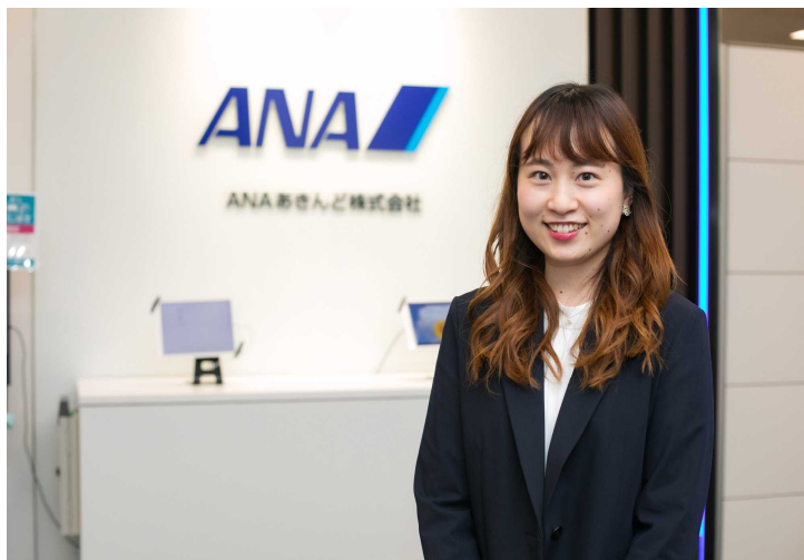
行政 ANAあきんど株式会社 派遣職員（2023年度）